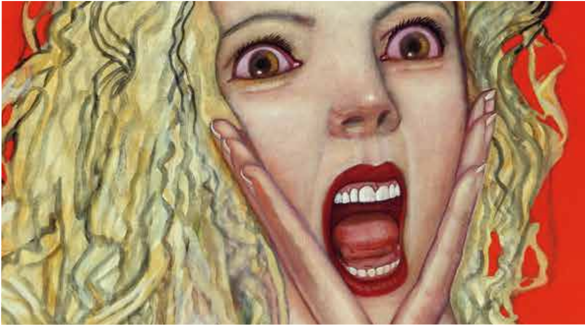
Pat Andrea, 'Bebé Tinto' (detail)